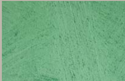
68 • 100 ml T31