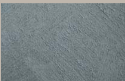
28 • 15 ml T24