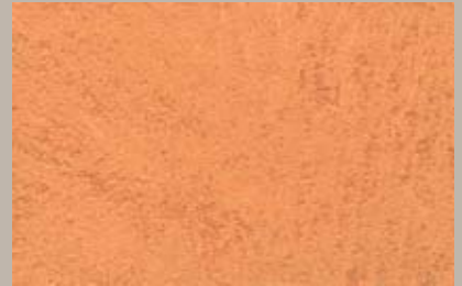
7 • 100 ml T27