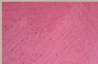
54 • 200 ml T28 + 15 ml T29