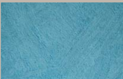
22 • 15 ml T30