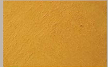
41 • 50 ml T25 + 50 ml T27