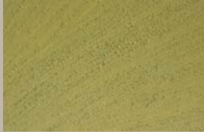
65 • 50 ml S1 + 15 ml T31 + 30 ml T25