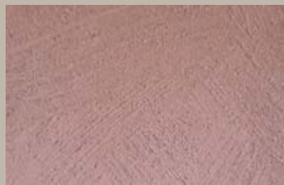
52 • 15 ml T24 + 50 ml S2