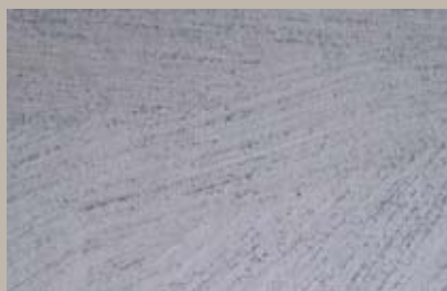
56 • 50 ml T29 + 50 ml T22 + 15 ml T30