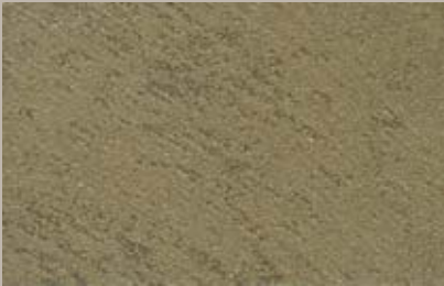
5 • 30 ml T24