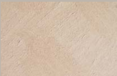
17 • 15 ml T21