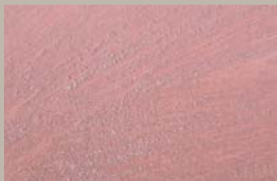
50 • 50 ml T22