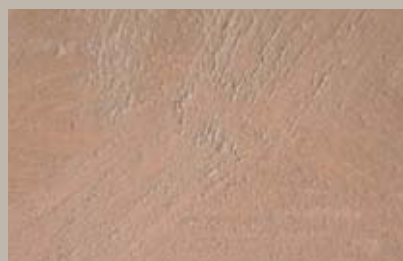
45 • 50 ml S3