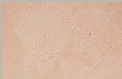
15 • 15 ml T27