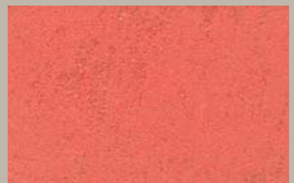
13 • 200 ml T28