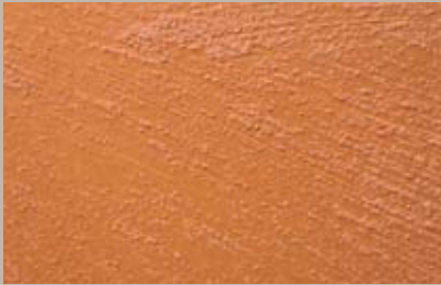
29 • 200 ml T34