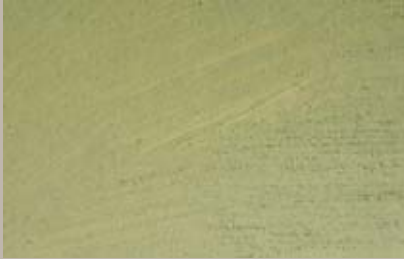
64 • 15 ml T31 + 50 ml S1