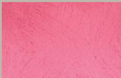
53 • 200 ml T28