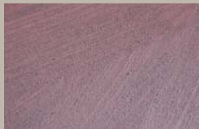
27 • 200 ml T28 + 15 ml T24