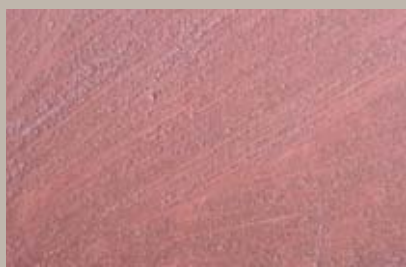
48 • 100 ml T22