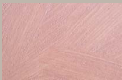
47 • 15 ml T22