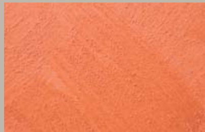
18 • 200 ml T27