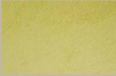
62 • 100 ml T25