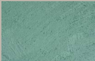
19 • 50 ml S6