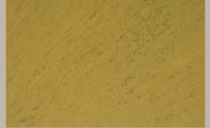
66 • 200 ml S1 + 15 ml T31