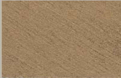
6 • 50 ml T28 + 15 ml T24