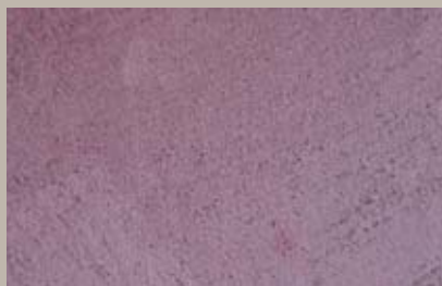
55 • 50 ml T22 + 50 ml T29