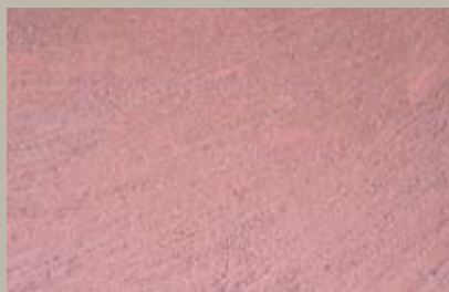
51 • 150 ml T22