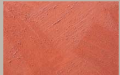
43 • 50 ml S2