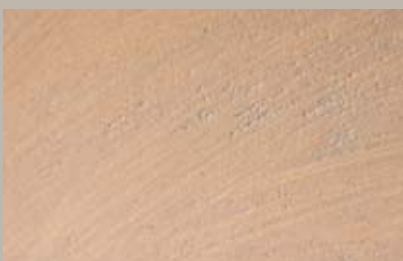
44 • 50 ml T23