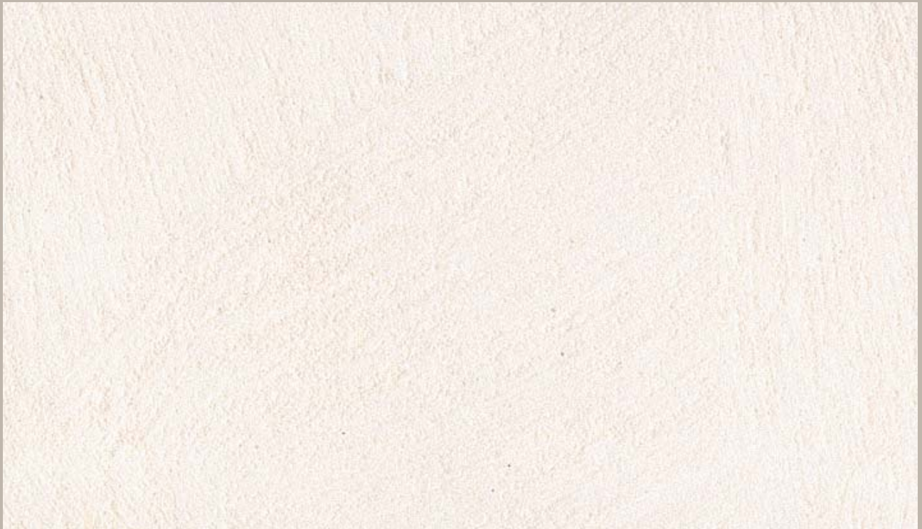
2 • Samsara Argento (Silver)