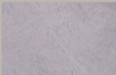
24 • 15 ml T29