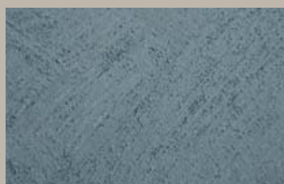
31 • 100 ml S4