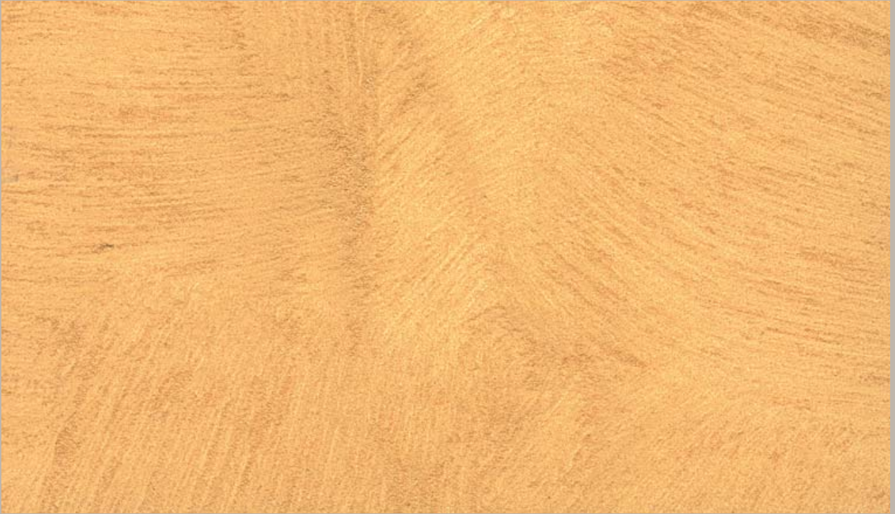
1 • Samsara Oro (Gold)