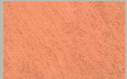
10 • 50 ml T28