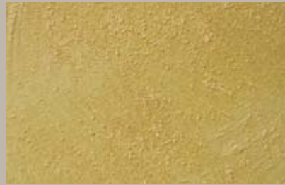
23 • 30 ml T34