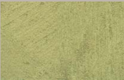
8 • 50 ml T32