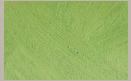
63 • 100 ml T25 + 15 ml T31