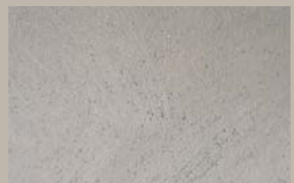
46 • 15 ml T24 + 50 ml S3