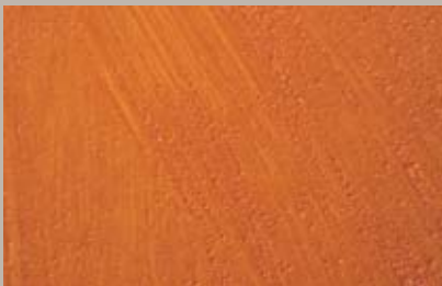
42 • 100 ml T25 + 100 ml T27