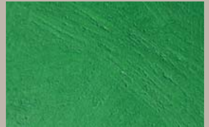
69 • 250 ml T31