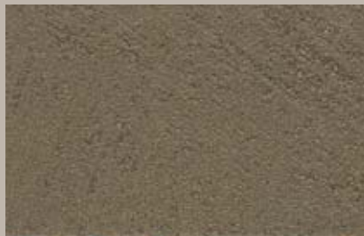
9 • 200 ml T29 + 50 ml T24