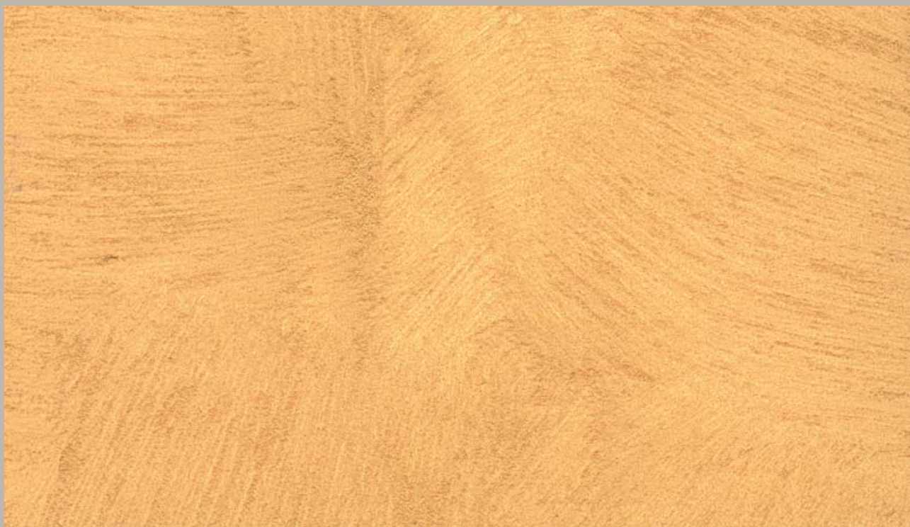
80 • Samsara Oro vivo (Bright gold)