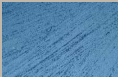
60 • 100 ml T30 + 100 ml T28