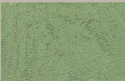
11 • 50 ml S5