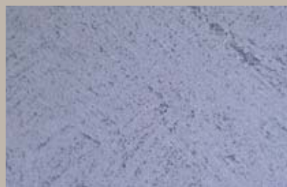
57 • 100 ml T28 + 50 ml T30