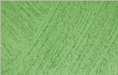
67 • 100 ml T25 + 50 ml T31