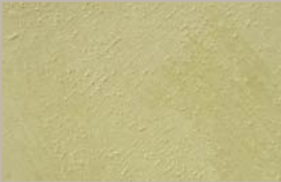
20 • 15 ml T26