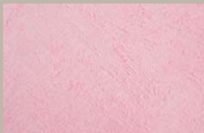
21 • 15 ml T28