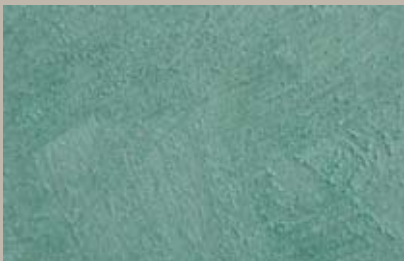
16 • 15 ml T32