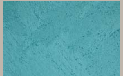
25 • 50 ml S5