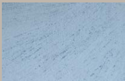
58 • 15 ml T30 + 15 ml T28