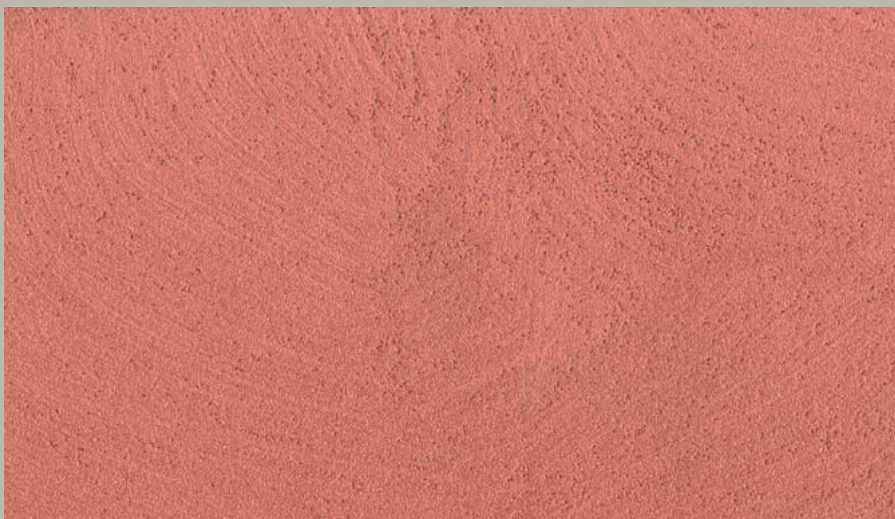
4 • Samsara Rame (Copper)