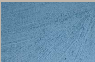
59 • 50 ml T30 + 50 ml T28