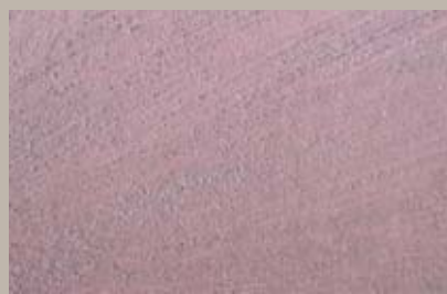
49 • 100 ml T22 + 15 ml T30 + 15 ml T28