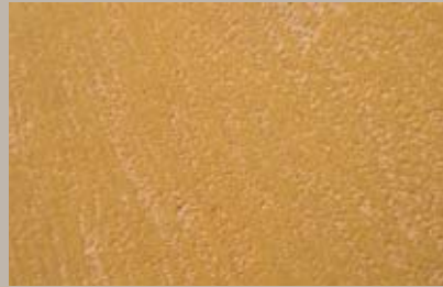
40 • 50 ml T25 + 15 ml T27