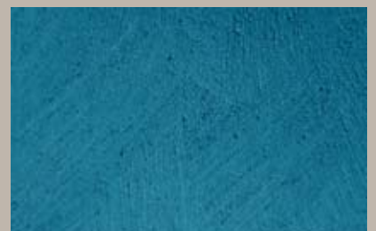
71 • 50 ml S5 + 100 ml T30 + 15 ml T24