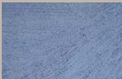
30 • 200 ml T28 + 15 ml T24 + 50 ml T30