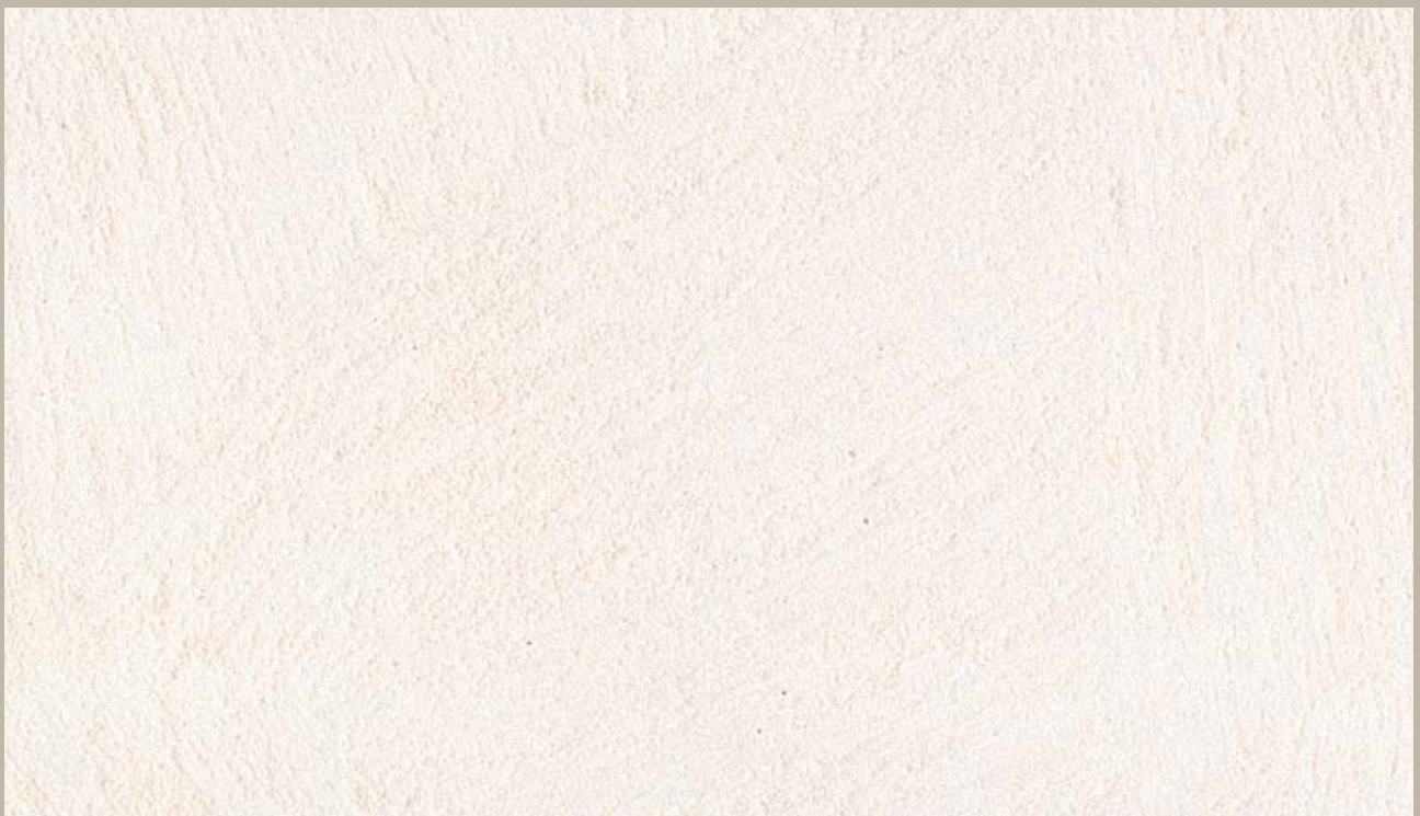
2 • Samsara Argento (Silver)