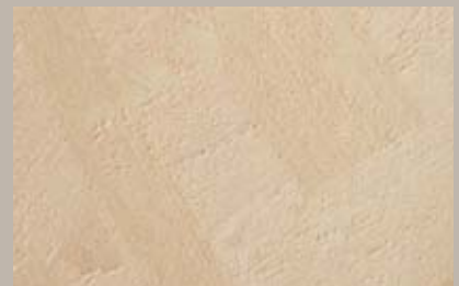
14 • 15 ml T23