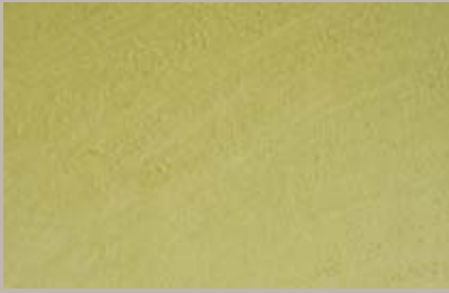
61 • 50 ml T25