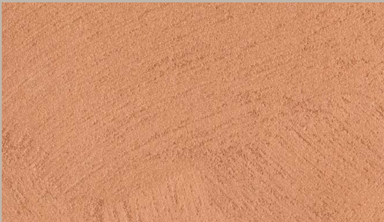
3 • Samsara Bronzo (Bronze)