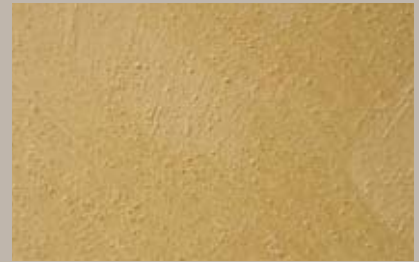
26 • 50 ml S1